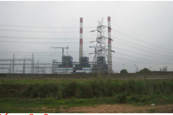
ନିର୍ମାଣଧାର ଥିବା ଜିକେଇଏଲ କୋଇଲା ପାୱାର ପ୍ଲାଣ୍ଟ

ଦାଖଲ କରିଥିଲେ । ଅଭିଯୋଗକାରୀ ମାନେ ଧାରାବାହିକ ଭାବେ ଏହି ପ୍ରକଳ୍ପ ଦ୍ୱାରା ଗ୍ରାମବାସୀ, ସ୍ଥାନୀୟ ପରିବେଶ ଉପରେ ପଡୁଥିବା ଏବଂ ସମ୍ଭାବିତ ପ୍ରଭାବ ବିରୋଧରେ ଆରୋପ ଅଭିଯୋଗ କରିଆସିଛନ୍ତି । ସେମାନେ କହିଛନ୍ତି ଯେ, ସ୍ଥାନୀୟ ଲୋକଙ୍କ ଉପରେ ଯେଉଁଭଳି ନିଷ୍ଠି ସବୁ ପ୍ରଭାବ ପକାଇବ; ସେହିସବୁ ନିଷ୍ଠି ଗ୍ରହଣ ପ୍ରକ୍ରିୟାରେ ସେମାନଙ୍କୁ ସମ୍ମୁଖ କରାଯାଇନାହିଁ । ସେଠାରେ ଜମି ଅଧିଗ୍ରହଣ ପ୍ରକ୍ରିୟାରେ ଅନିମିତ୍ତ ହୋଇଥିଲା । ପୋଲିସ୍ ଦ୍ୱାରା ଗ୍ରାମଗୋଷ୍ଠୀକୁ ଖରାପ ବ୍ୟବହାର ପଦର୍ଶନ ଆଦି ହୋଇଥିଲା ବୋଲି ସେମାନେ ଅଭିଯୋଗ କରିଥିଲା ବେଳେ ପ୍ରକଳ୍ପ ଦ୍ୱାରା ପରିବେଶ ଏବଂ ସମାଜ ଉପରେ ସମ୍ଭାବିତ ବିପଦର ଆଖଙ୍କା ସହିତ ଏଥିରେ ଆଇଏଫସିର ଅର୍ଥନୈତିକ ଭୂମିକା ଭଳି ବିଷୟକୁ ଉନ୍ମୁକ୍ତ ରଖାଯାଇ ନାହିଁ ବୋଲି ମଧ୍ୟ ସେମାନେ ଅଭିଯୋଗ କରିଛନ୍ତି ।