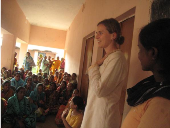
ପ୍ରଭାବିତ ଗ୍ରାମଗୋଷ୍ଠୀକୁ ଭେଟିବା ଲାଗି ସିଏଓଙ୍କ ପ୍ରଥମ ଅନୁସନ୍ଧାନ ପରିଦର୍ଶନ

ସେପ୍ଟେମ୍ବର ୨୦୧୧ରୁ ମାର୍ଚ୍ଚ ୨୦୧୨ ମଧ୍ୟରେ ଅଂଶୀଦାରମାନଙ୍କ ସହିତ ସାକ୍ଷାତ ପାଇଁ ସିଏଓଙ୍କ ଦଳ ଚାରିଥର ପରିଦର୍ଶନ କରିଥିଲେ ଏବଂ କ୍ରମାନ୍ୱୟ ଭାବେ ଟେଲିଫୋନ୍ ମାଧ୍ୟମରେ ଅଭିଯୋଗକାରୀ, ପୃଷ୍ଠପୋଷକ, ଆଇଏଫସି ଗ୍ରାହକ, ନିର୍ଦ୍ଦିଷ୍ଟ ଭାରପ୍ରାପ୍ତ ସରକାରୀ ଅଧିକାରୀ, ନାଗରିକ ସମାଜ ଅନୁଷ୍ଠାନ (ସିଏସ୍‌ଓ) ଓ ବେସରକାରୀ ଅନୁଷ୍ଠାନ (ଏନଜିଓ)ଙ୍କ ସହିତ ବାର୍ତ୍ତାଳାପ ଜାରୀ ରଖିଥିଲେ।