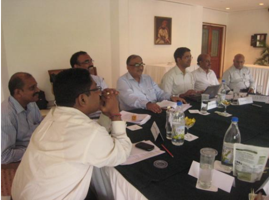
କମ୍ପାନୀ କର୍ମୀଙ୍କ ସହିତ ଆଲୋଚନା

ଜୁଲାଇ ୨୦୧୨: ଅଂଶୀଦାରମାନଙ୍କୁ ନେଇ ପ୍ରକ୍ରିୟାର କାର୍ଯ୍ୟପ୍ରଣାଳୀ ନିର୍ଣ୍ଣୟ ଲାଗି ଜୁଲାଇ ୨୦୧୨ରେ କିଛି ବୈଠକ ଆୟୋଜନ କରାଯାଇଥିଲା ଏବଂ ଆଲୋଚନାର ବିଷୟବସ୍ତୁ ସହିତ ବୈଶିଷ୍ଟ୍ୟ ଓ ଅଂଶୀଦାରଙ୍କ ଭବିଷ୍ୟତ ନିୟୋଗ ଲାଗି କ’ଣ ନିୟମ ରହିବ ତାହା ମଧ୍ୟ ଆଲୋଚନା କରାଯାଇଥିଲା । ଏହି ବୈଠକ ମାନଙ୍କରେ ଗୋଟିଏ ଗୁରୁତ୍ୱପୂର୍ଣ୍ଣ ବିଷୟ ଆଲୋଚନା ହୋଇଥିଲା ଯେ, କିଏ ଆଲୋଚନା ପ୍ରକ୍ରିୟାରେ ଅଂଶଗ୍ରହଣ କରିବେ; କେଉଁମାନେ ମୁଖ୍ୟ ଆଲୋଚନା ଟେବୁଲରେ ବସିବେ, କେଉଁମାନେ ଆଲୋଚନା ହେଉଥିବା କକ୍ଷରେ ରହିପାରିବେ, ଏବଂ କିଏ କେଉଁ କ୍ଷମତା ଆଧାରରେ ଆଲୋଚନାରେ ଅଂଶଗ୍ରହଣ କରିବେ ।